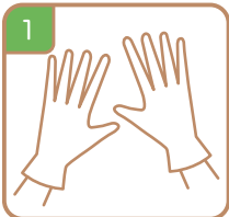
1 ゴム手袋をする Put on gloves