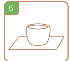
5 室内で自然乾燥 Let it dry