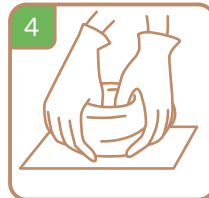
4 成形する Form an object you like